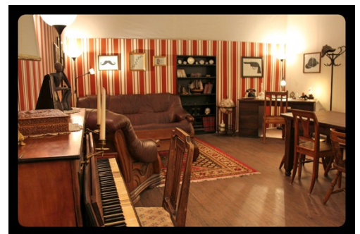
ESPACE D'ACCUEIL « SHERLOCK »